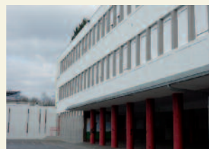
Le collège Sonia Delaunay retenu pour l'implantation du Noeud de Raccordement Optique principal

le Conseil communautaire de l'Aire cantilienne vote la compétence du très haut débit. Le transfert de compétence se fera après le vote des conseils municipaux, le 1 er janvier 2014. Il ne remet aucunement en cause la chronologie pour Gouvieux.