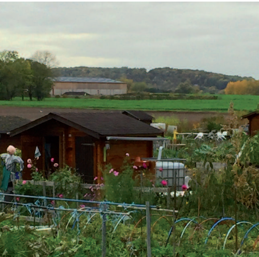
Les jardins familiaux, particulièrement touchés ces dernières années

Aux jardins familiaux, les "indélicatesses" ne s'arrêtent pas là. Elles concernent également le vol de chalets municipaux, installés pourtant de manière durable, et