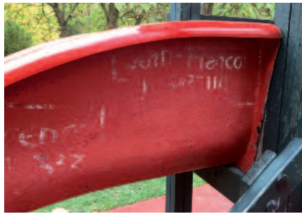
Les tags, une lutte coûteuse