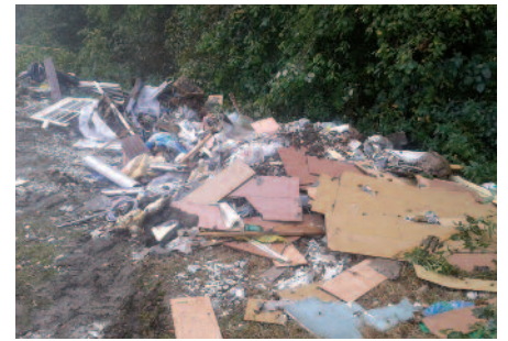
La nature godvicienne est exposée aux dépôts sauvages