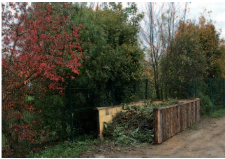
Une installation fixe et rustique en remplacement des bennes volées