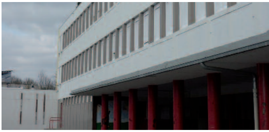
Les collèges restent de la responsabilité du département