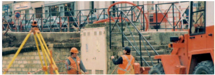
Les aides aux petites et moyennes entreprises, c'est désormais la région seule qui s'en occupe