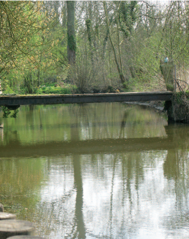
Le conseil régional, compétent en matière d'environnement

La nouveauté de ces schémas tient principalement à leur caractère obligatoire, s'imposant aux décisions des autres collectivités.