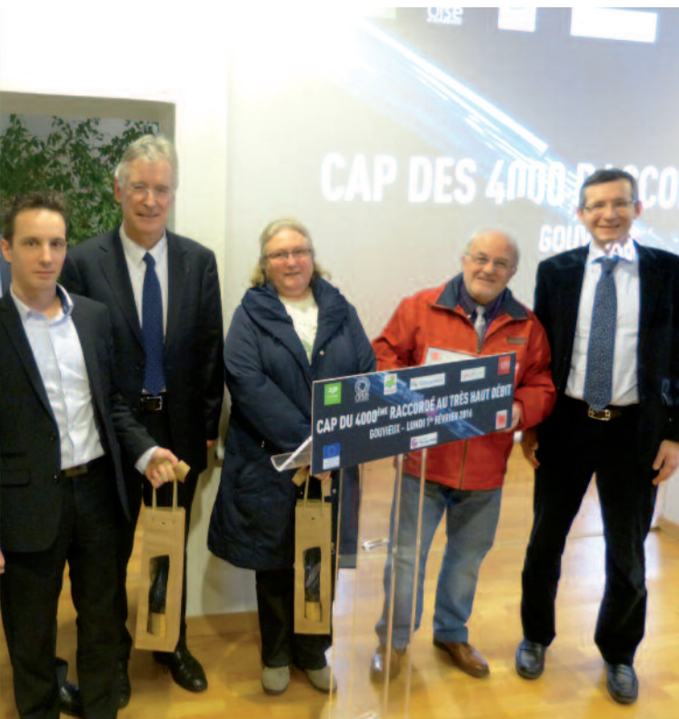
Ce lundi 1 er février, les élus se rassemblaient pour fêter le passage du 1 000 e abonné à Gouvieux et 4 000 e dans l'Oise.

nous fallait trois jours pour les recevoir, autant dire impossible dans notre univers professionnel hyper réactif et concurrentiel... La fibre optique et ses 250 mégabits de débit (et son temps de réponse de 10 millisecondes, les spécialistes apprécieront, NDLR ) nous permet de les recevoir aujourd'hui en moins de 10 minutes ! ". Mieux encore, la qualité du débit permet à l'entreprise de faire du e-training, de la formation à distance, dans la France entière, lui évitant désormais d'avoir à multiplier les déplacements à Bordeaux, Strasbourg, Marseille ou Montpellier.