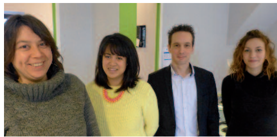
Gaboweb, une agence web de 6 personnes s'installe à Gouvieux, grâce au Très haut débit