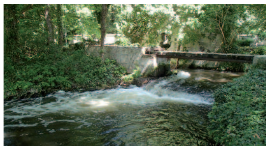
Ouvrage en ruine sur la Nonette