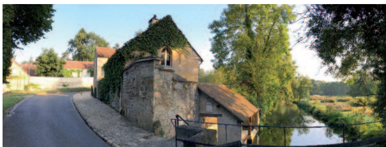
Moulin de la Chaussée