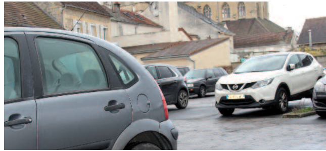
À l'angle de la rue Corbier-Thiebaut et de la rue Baronne de Rothschild, le parking est situé en zone bleue