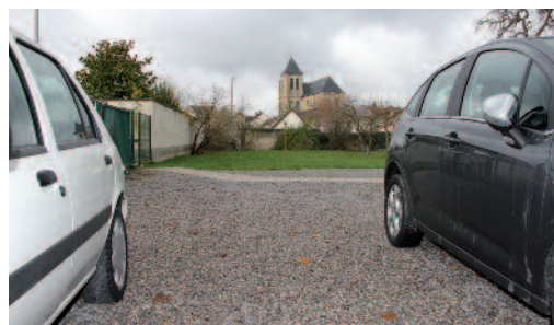
Parmi les onze zones de report de stationnement, l'aire de la rue des Repas est très proche du centre-ville