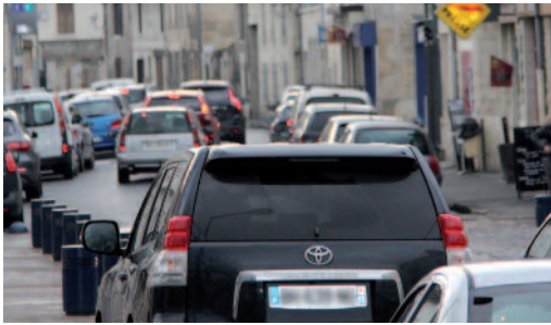
Les rues du centre ville ont besoin de retrouver de la fluidité