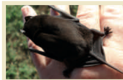
Le Petit Rhinolophe

Avant la réalisation de travaux susceptibles de porter atteinte à des individus et/ou à des gîtes de chauves-souris, comme l'abattage d'arbres comportant des cavités, le maître d'ouvrage doit s'assurer de l'absence de ces mammifères sur le site. En cas de recherche positive, un dossier de dérogation "espèce protégée" doit être élaboré pour obtenir l'autorisation de mettre en œuvre le projet envisagé. Ce dossier fait état des inventaires existants pour évaluer la fréquentation du site par les chauves-souris et présenter un ensemble de mesures à mettre en œuvre pour "éviter, réduire, compenser" les impacts identifiés.