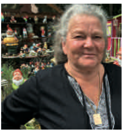
Certains jours d'été, une centaine de visiteurs s'arrêtent devant le jardin de Rose pour regarder cette impressionnante colonie de nains de jardin

En tout cas, sachez que toute personne est autorisée à entrer pour prendre des photos. A vous de saisir cette adorable invitation... 📷